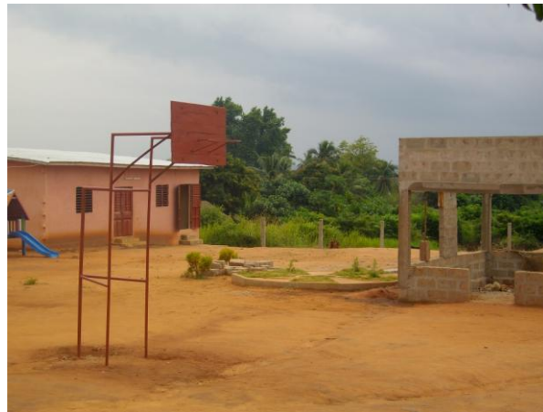
Les panneaux de basket sont désormais fixés.

Les fondations de la dernière réserve sont terminées : ne restera plus que la toiture et les portes et fenêtres. Une clôture doit être mise pour délimiter clairement le terrain appartenant à l'association doit être faite. Les poteaux ont déjà été installés.