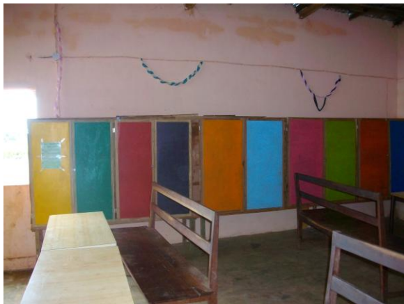
Des casiers servant de bibliothèque et de rangement pour les jeux ont été également construits.

En ce qui concerne les travaux, les choses avancent vraiment très bien. Des étagères dans les dortoirs des enfants ont été installées. Chacun a désormais son endroit pour entreposer ses affaires.